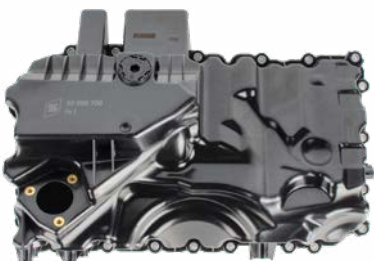
Nº do produto 50008700

Die serienmäßigen Ölwannen aus Kunststoff bieten bei modernen Fahrzeugen bereits viele Vorteile. Unsere neue, verbesserte Variante aus Aluminium setzt jedoch Maßstäbe in puncto Leistung und Robustheit.