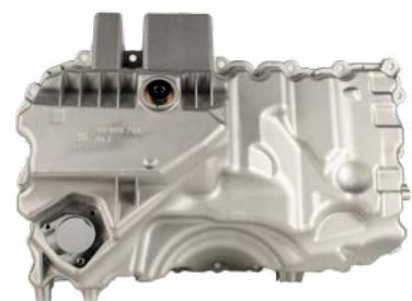
Nº do produto 50008701