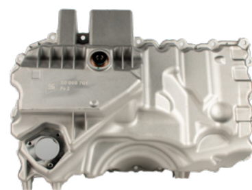
N. art. 50008701