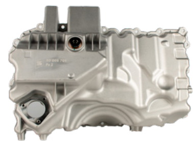
Nº do produto 50008701