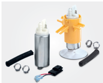
Caso necessário, os kits de peças de reposição são acompanhados pelos meios auxiliares necessários