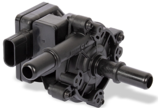
Bomba AKF 7.11390.00.0