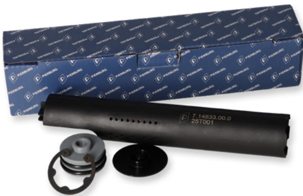
Filtro secador con accesorios (n.º art. 7.14833.00.0) para Tesla

Motorservice cuenta con un kit de servicio compuesto por un filtro secador y accesorios (n.º art.: 7.14833.00.0; referencia de recambios originales: 1597579-A0-A) para el circuito de refrigerante de Tesla en su catálogo del mercado posventa. Con este filtro secador, Motorservice cubre más de 3,7 millones de vehículos del fabricante de vehículos eléctricos en todo el mundo.