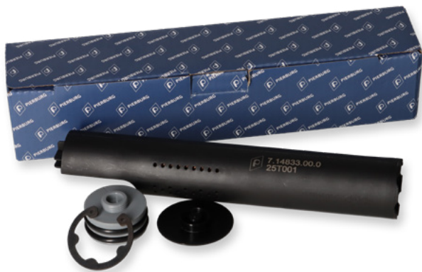
Filtre déshydrateur avec accessoires (réf. 7.14833.00.0) pour Tesla

Motorservice a ajouté un kit d'entretien comprenant un filtre déshydrateur et des accessoires (réf. 7.14833.00.0, référence OE 1597579-A0-A) pour le circuit de réfrigérant Tesla à son programme de marché de la recharge. Avec ce filtre déshydrateur, Motorservice couvre plus de 3,7 millions de véhicules du constructeur de véhicules électriques dans le monde entier. Le kit d'entretien est adapté aux modèles suivants :