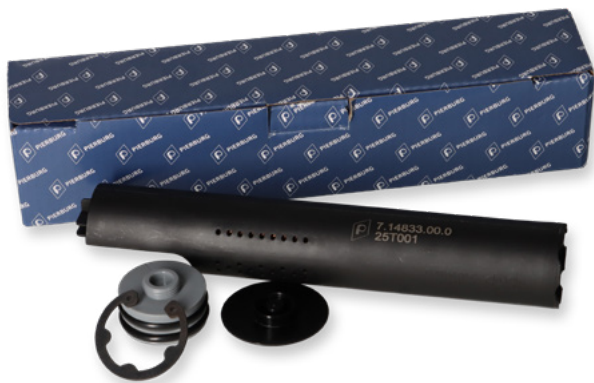
Filtro essiccatore con accessori (codice articolo 7.14833.00.0) per Tesla