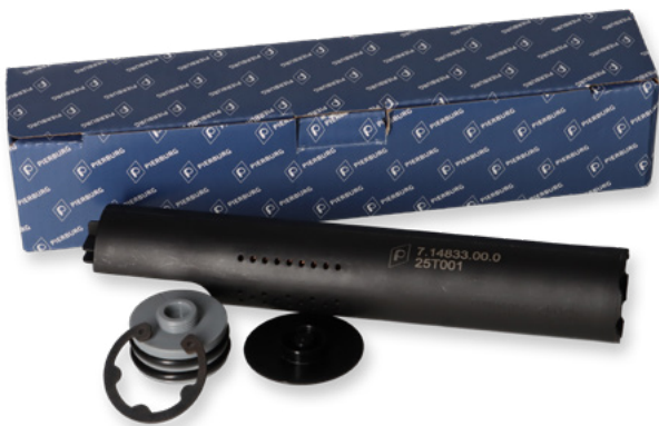
Filtr osuszacz z akcesoriami (nr art. 7.14833.00.0) do modeli marki Tesla