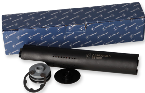
Secador de filtro com acessórios (art. nº 7.14833.00.0) para Tesla

A Motorservice incluiu em seu programa de pós-venda um kit de serviço composto por secador de filtro e acessórios (art. Nº7.14833.00.0, referência OE 1597579-A0-A) para o circuito de gás refrigerante da Tesla. Com o secador de filtro, a Motorservice cobre mais de 3,7 milhões de veículos do fabricante de veículos elétricos em todo o mundo. O kit de serviço é adequado para os seguintes modelos: