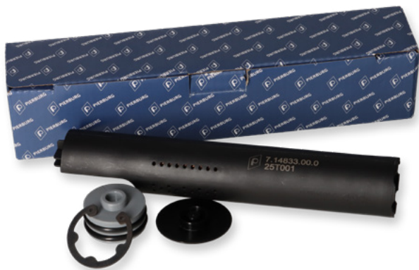
Фильтр-осушитель с сопутствующими деталями (тов. № изделия 7.14833.00.0) для Tesla