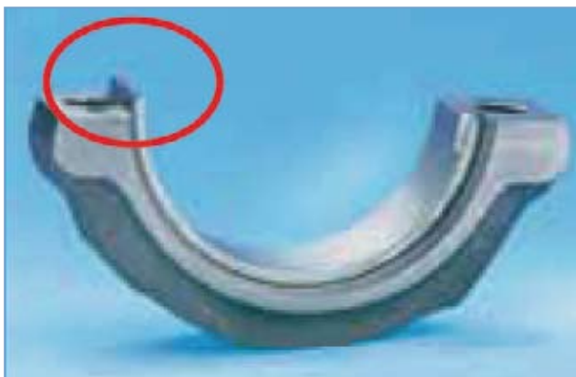
Abb. 1 Lagerüberstand, stark übertrieben dargestellt

Bei der Überholung von Motorblöcken oder Pleuelstangen muss sehr genau darauf geachtet werden, dass die Grundbohrungen innerhalb der Herstellerspezifikation