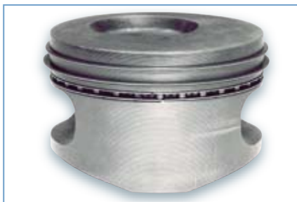
Abb. 1 Kein Verschleiß an Ringen oder am Kolben sichtbar

Die Ringe zeigen keinen sicht- oder messbaren Verschleiß. Auch die Kolben haben keine Verschleißmerkmale (Abb. 1).