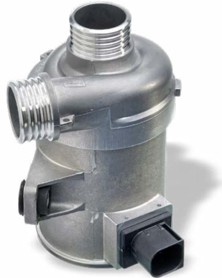
CWA400 – ejemplo de bomba de agua

Tras el montaje del nuevo radiador EGR, es necesario asegurarse de purgar el circuito de líquido refrigerante según las indicaciones del fabricante. De este modo se evitan las burbujas de aire, también llamadas hotspots.