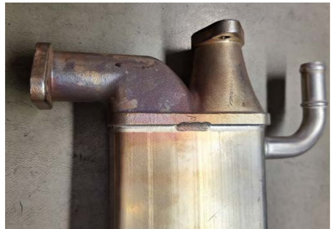
Formación de burbujas y grietas (izquierda) y decoloración clara (derecha) – Patrones típicos de daños en caso de sobrecarga térmica

Motorservice recibe con frecuencia radiadores EGR que presentan daños térmicos poco después del montaje. Estos daños se deben directa o indirectamente a una sobrecarga térmica.