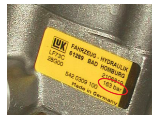
LuK čerpadlo posilovače řízení s tlakovým omezovacím ventilem