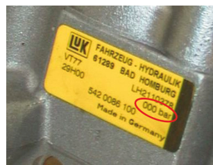
LuK čerpadlo posilovače řízení bez tlakového omezovacího ventilu

Oba typy konstrukce mají v závislosti na výrobci čerpadla následující odlišnosti typových štítků: