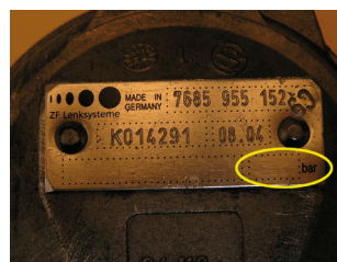
ZF čerpadlo posilovače řízení bez tlakového omezovacího ventilu