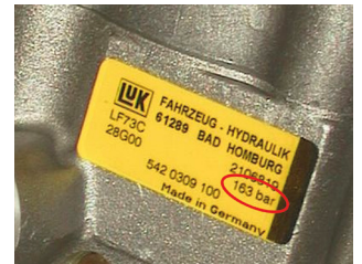
LuK kormány servo-szivattyú nyomáshatároló szeleppel