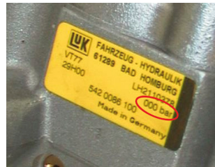
LuK kormány servo-szivattyú nyomáshatároló szelep nélkül

A két építési mód a következő, gyárilag eltérő a típusablával rendelkezik: