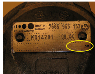
ZF kormány servo-szivattyú nyomáshatároló szelep nélkül