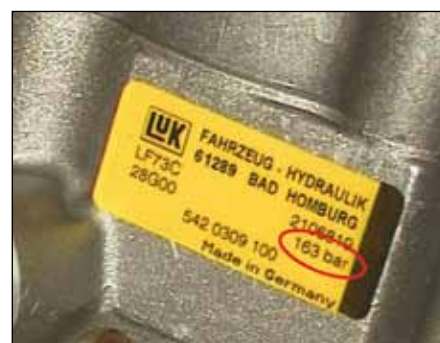
LuK servočrpalka za krmilo z omejevalnim tlačnim ventilom