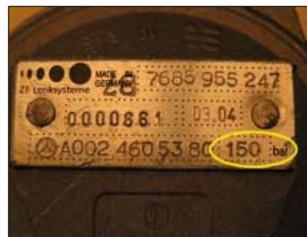
ZF servočrpalka za krmilo z omejevalnim tlačnim ventilom

Omejevalni tlačni ventil skrbi, da servočrpalka za krmilo v nobenem pogonskem stanju servokrmila ne potiska proti zaprtemu sistemu in ne ustvarja previsokega tlaka. Če omejevalni tlačni ventil ne deluje, servočrpalka za krmilo toliko časa gradi tlak, dokler ne uniči ene od komponent servokrmila.