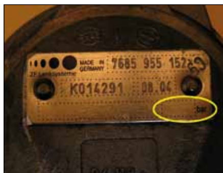
ZF servočrpalka za krmilo brez omejevalnega tlačnega ventila

Krmilni sistemi ZF (ZF Lenksysteme) je registrirana poslovna oznaka skupnega podjetja Robert Bosch GmbH in ZF Friedrichshafen AG. Navedene kataloške številke so namenjene izključno za primerjavo.