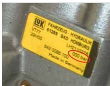
LuK servočrpalka za krmilo brez omejevalnega tlačnega ventila

Obe konstrukciji imata naslednje tipske ploščice, ki se razlikujejo glede na proizvajalca: