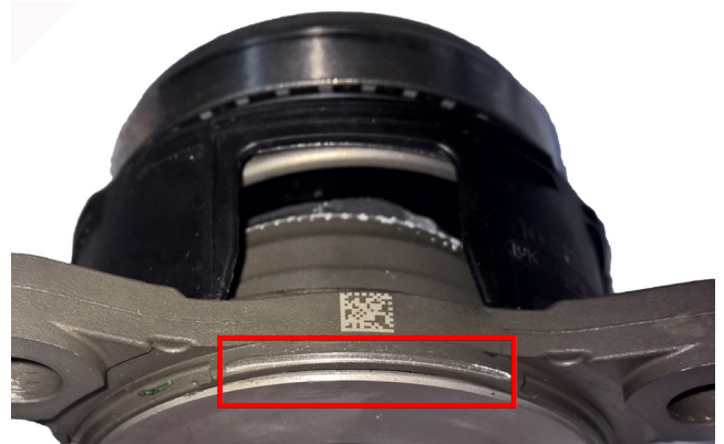
Kuva 2: Vaurioitunut painelaakerin tiiviste