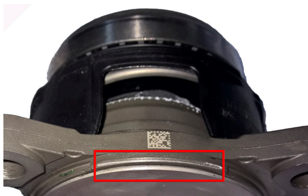
Fig. 2: Cilindru receptor concentric stricat, cu garnitura de etanșare separată