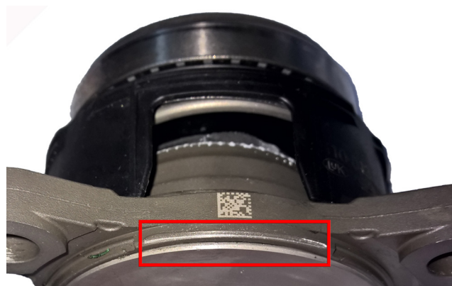
Bild 2: Bild på skadad slavcylinder där tätningringen har lossnat