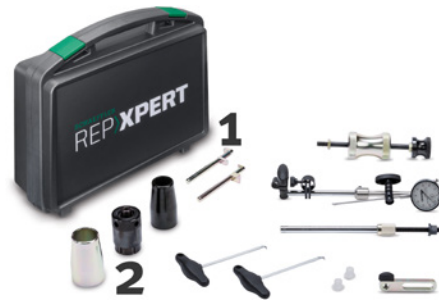
Imagen 2: Kit de herramientas especiales LuK 400 0540 10 anterior