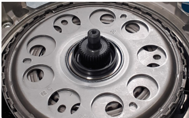
Imagen 1: Disco de accionamiento con aberturas circulares

Una característica distintiva de la variante optimizada de embrague doble es el disco de accionamiento con aberturas circulares (figura 1). El perno de retención anterior para las cajas de cambios DQ 380/81 y DQ 500 (1 en la figura 2) no se ajusta a esta versión. Se debe utilizar un perno de retención modificado para el montaje. Ahora este perno viene incluido en cada nuevo kit de herramientas especiales LuK 400 0540 10.