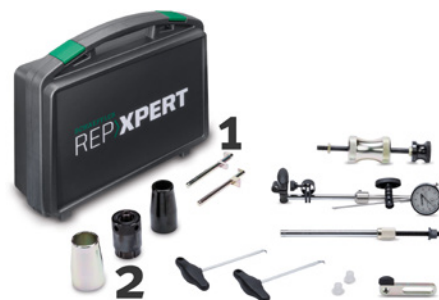
Figure 2 : Ancien kit d'outillage spécial LuK 400 0540 10