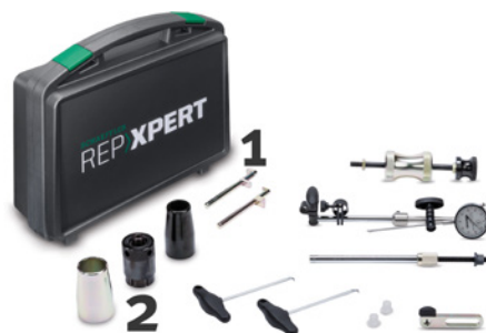
Figura 2: Anterior kit de ferramentas especiais LuK 400 0540 10

N.º de peça: 400 0540 10 400 0620 10 602 0036 00 602 0039 00