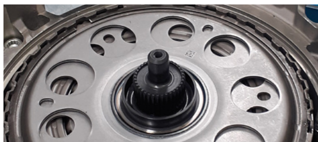
Figura 1: Cobertura com aberturas circulares

Uma característica distintiva da variante de embraiagem dupla otimizada é a cobertura com aberturas circulares (Figura 1). O anterior parafuso de fixação para as caixas de velocidades DQ 380/81 e DQ 500 (elemento 1 na Figura 2) não é compatível com esta versão. Deve ser utilizado um parafuso de fixação modificado para a respetiva montagem. Este também está agora incluído em todos os novos kits de ferramentas especiais LuK 400 0540 10.