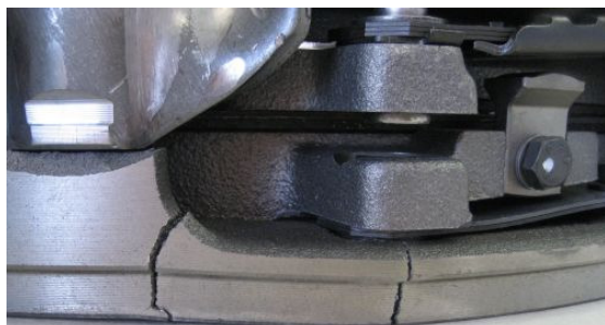
Sl. 4: Puknuti umetnuti disk

Ovako oštećene pritiskne ploče ne smeju nikako da se ugrade, jer inače mora da se računa s visokim troškovima, kao s posledicom!