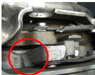
Sl. 2+3: Puknuća oka umetnutog diska