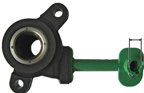
Sl. 1: CSC 3182 600 121 → 3182 654 165 Premer hidravličnega priključka 11,7 mm