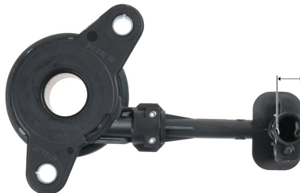
Sl. 4: CSC 3182 600 140 → 3182 654 204 Premer hidravličnega priključka 12,2 mm

Prosimo, upoštevajte, da hidravlični priključki naprav za izklapljanje niso prikazani v ustreznem merilu.