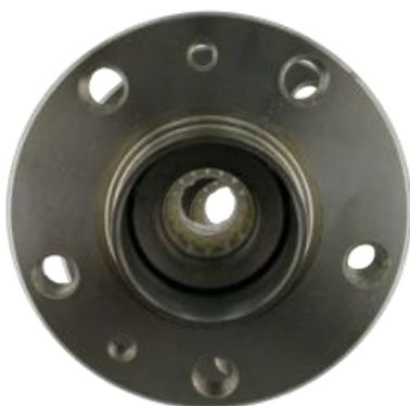
Rodamiento con acople plástico

SKF utiliza soluciones de embalaje seguras para proteger el rodamiento de rueda de daños durante el transporte o el montaje. El VKBA 1440 se entrega con un acople plástico para mantener unidos los anillos interiores hasta su montaje en el vehículo.