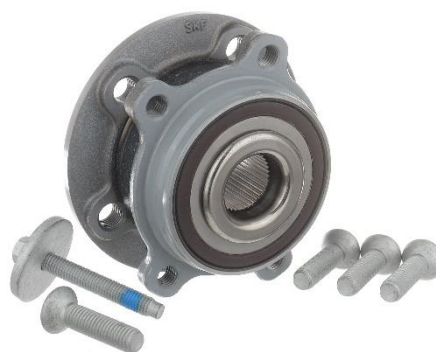
Contenido del kit nuevo