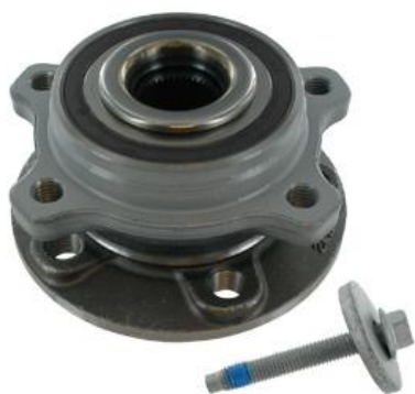
Contenido del kit antiguo

SKF añadirá 4 tornillos de brida en el kit VKBA 7132 desde el lote ID 205-206 X, asegurando de esta forma que se incluyen todos los elementos para garantizar una reparación completa.