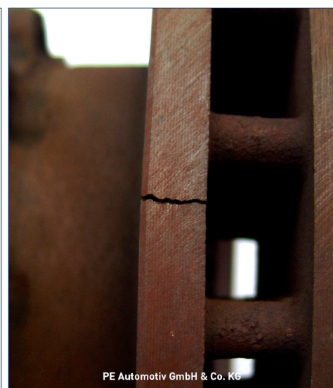
PE Automotiv GmbH & Co. KG