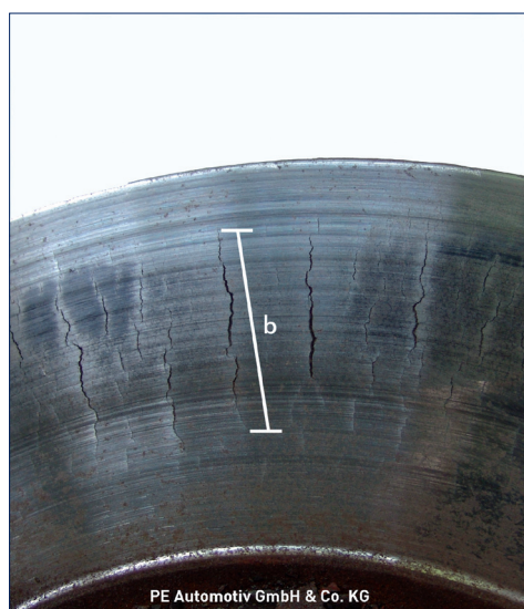
PE Automotiv GmbH & Co. KG

Des disques de frein avec une charge thermique accrue (coloration rouge dans un canal de circulation d'air) et des ruptures jusqu'à un canal de circulation d'air ne sont pas admissibles. Les disques de frein doivent être remplacés selon le type d'essieu.