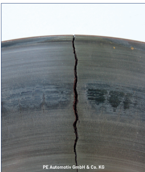
PE Automotiv GmbH & Co. KG