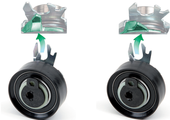
図1：左 - テンショナープーリー 531 0252 30、右 - テンショナープーリー 531 0525 30

外観は非常によく似ていますが、技術的には大きく異なります。テンショナープーリー 531 0252 30 はテンショナープーリー 531 0525 30 よりも張力が大きく、動作範囲が広いです。