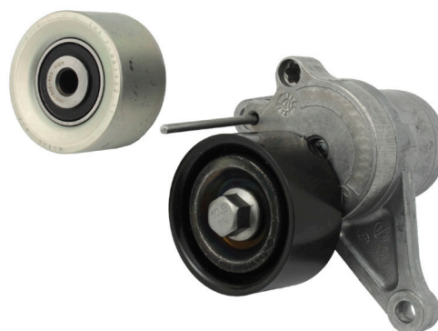
Рисунок 1: Металлический натяжитель и обводной ролик

OE номера: 82 00 725 951 (пластмассовый обводной ролик) 11 75 075 68R (пластиковый натяжной ролик) 82 01 003 525 (металлический обводной ролик) 11 75 009 69R (металлический натяжной ролик)