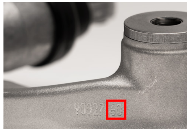
Imagen 2: La marca de la parte inferior puede terminar en 50 o 60

Ambos tensores de correa se pueden distinguir claramente entre sí observando las siguientes características de producción: el tensor de correa con referencia 534 0316 10 está equipado con el amortiguador F-551449.06-0100. La marca de la parte inferior del brazo (imagen 2) podría ser Y0927.50, por ejemplo. Este número 50 ubicado al final es determinante, ya que representa una fuerza de amortiguación de 3500 N +/- 800 N.