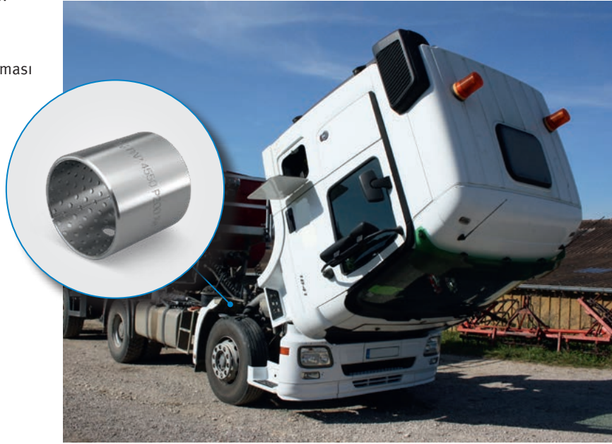
KS Permaglide® kaymalı yatak burcu Yapı türü PAP ... P200 ile yataklama