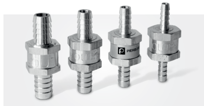
Топливные обратные клапаны 6 – 12 мм

Не используйте сочетания материалов, которые вместе с алюминием вызывают обычную или контактную коррозию, например, соленую воду или оцинкованные поверхности.