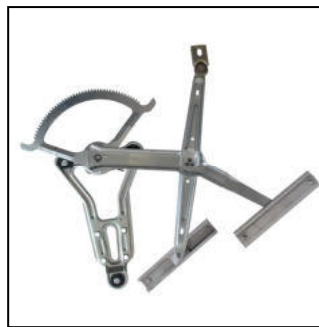
Alzacristallo originale – oem window regulator – lève-vitre original – Fensterheber von oem – elevalunas original – levandator de vidro original – orijinal cam acacagi - Γρύλος γνήσιος