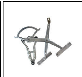
Nostro alzacristallo – our window regulator – notre lève-vitre – unser Fensterheber – nuestro elevalunas – nosso levantador de vidro – bizim cam acacagi - Γρύλος δικός μας