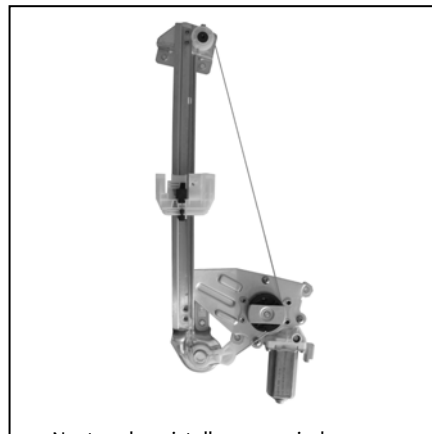
Nostro alzacristallo – our window regulator – notre lève-vitre – unser Fensterheber – nuestro elevalunas – nosso levantador de vidro - bizim cam acacagi - Γρύλος δικός μας