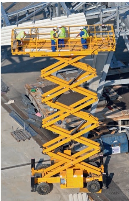
Plataforma de trabajo con articulación de tijera

Alojamiento en una articulación de tijera con casquillos de cojinete de fricción Permaglide® del tipo de construcción PAP ... P200