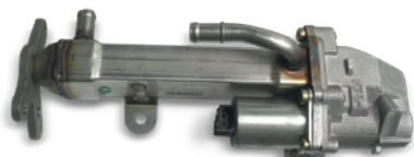
Fig. 1: Supapă EGR cu radiator EGR

Pentru a evita reparațiile costisitoare la motor în căutarea unei scurgeri de lichid de răcire, înainte de deschiderea motorului trebuie verificat cu precizie dacă există puncte neetanșe la radiatorul EGR.