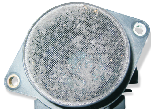
Засорение датчика расхода воздуха