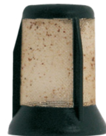
Vorfilter der E3T – verstopft durch Rost